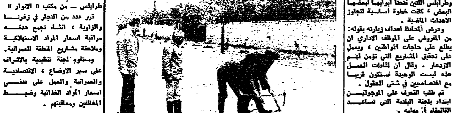
قوات الردع تساهم في فتح الطرق